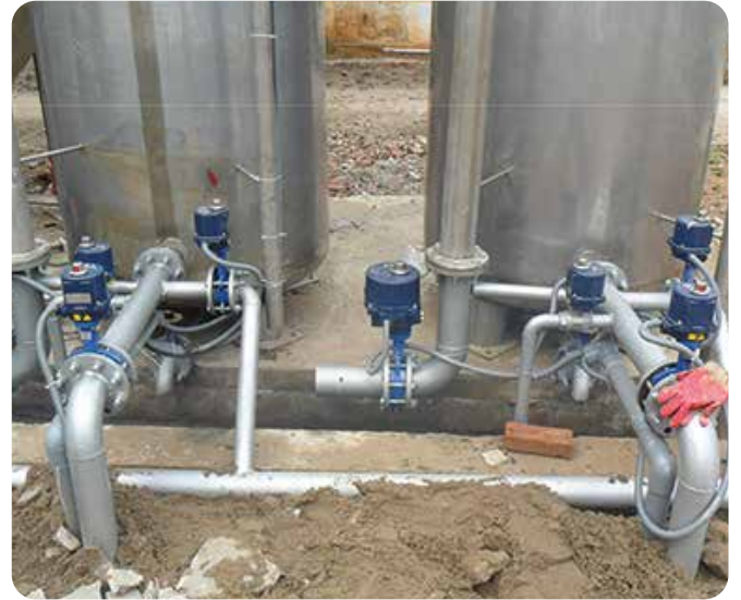
◆ Trạm xử lý nước ngầm, Bệnh viện 74 Trung ương, thị xã Phúc Yên, tỉnh Vĩnh Phúc