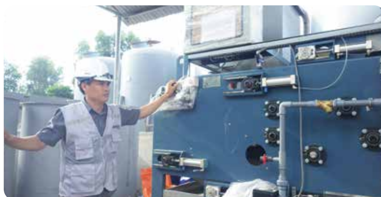
◆ Nhà máy nước thải Sông Công, tỉnh Thái Nguyên (2015)