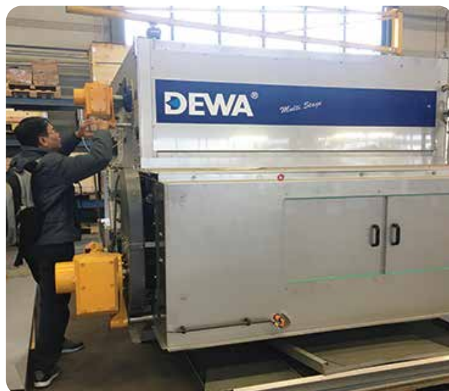
◆ Máy ép bùn cho dự án XLNT Thành phố Huế (2018)