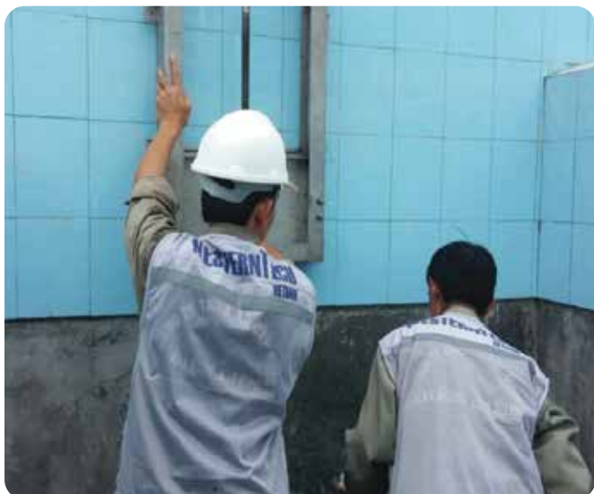
◆ Chế tạo và lắp đặt thiết bị dự án cấp nước Điện Biên