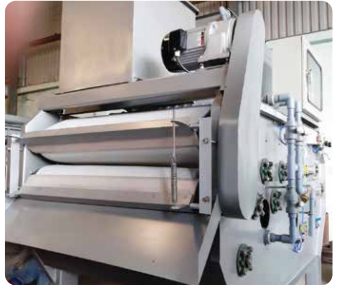
◆ Nhà máy nước thải công ty dệt may TAV, tỉnh Thái Bình