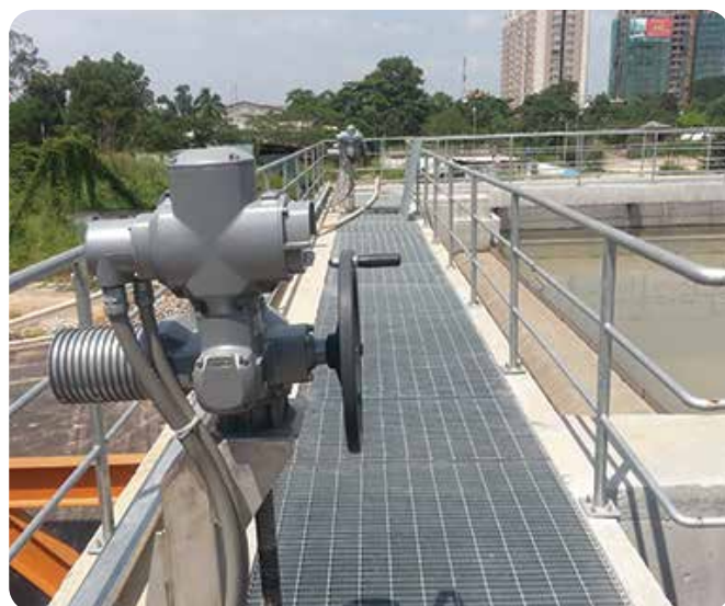
◆ Dự án cấp nước Thủ Đức, Thành phố Hồ Chí Minh - Giai đoạn 3