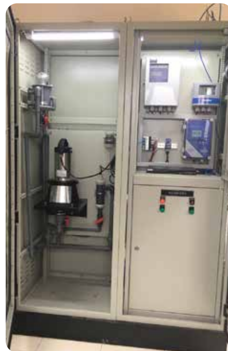
◆ Ủy ban nhân dân Thành phố Đông Hà, Quảng Trị Hệ thống Quan trắc nước thải tự động