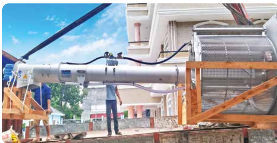
◆ Công ty CP Nước môi trường Bình Dương (BIWASE) Nhà máy Xử lý Nước thải Dĩ An, tỉnh Bình Dương