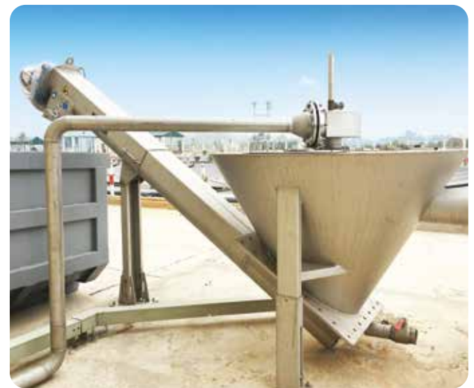
◆ Cung cấp và lắp đặt thiết bị công nghệ, cơ điện cho nhà máy xử lý nước thải thị xã Bỉm Sơn, tỉnh Thanh Hóa - CS Giai đoạn 1: 3500 m 3 / ngày (2016)