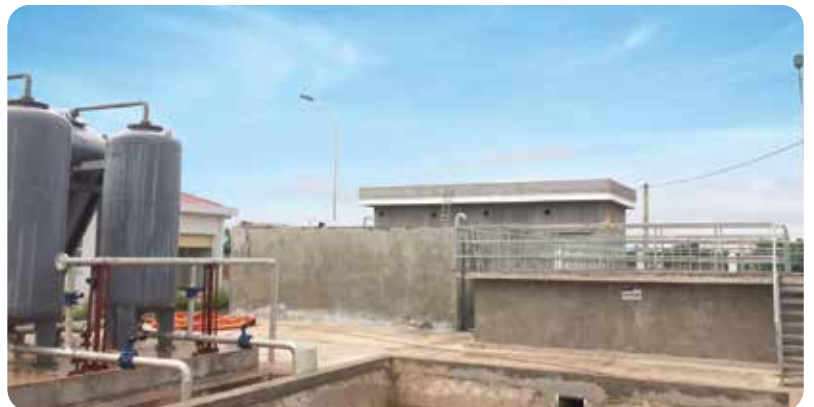
◆ Tập đoàn Sun Group Nhà máy xử lý nước mặt sân bay Vân Đồn