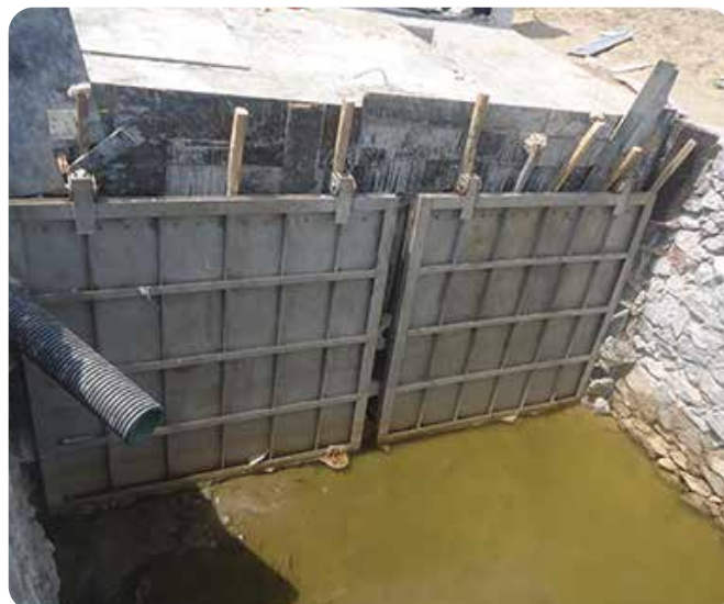
◆ Cung cấp và lắp đặt thiết bị van cửa phai, van cửa lật cho dự án FLC Samson Golf Link