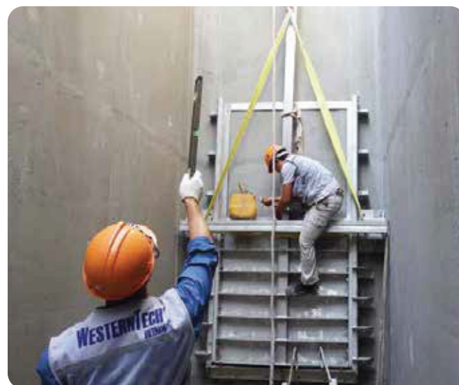
◆ Dự án cấp nước Thủ Đức, Thành phố Hồ Chí Minh - Giai đoạn 3