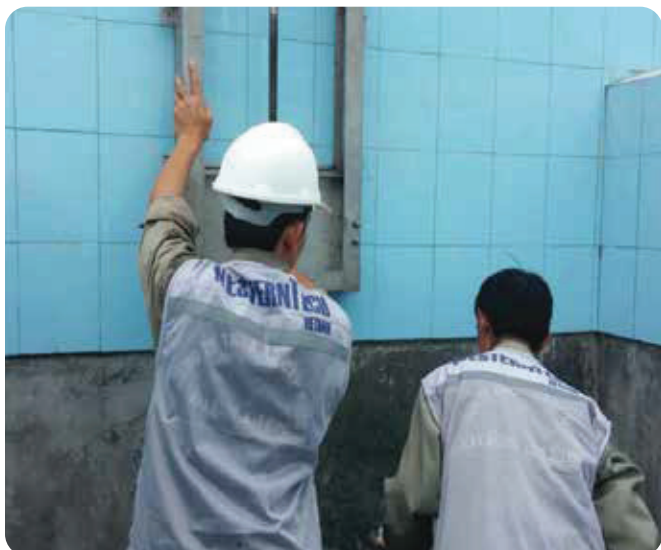
◆ Chế tạo và lắp đặt thiết bị dự án cấp nước Điện Biên