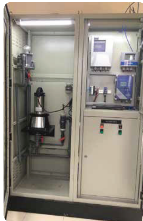
◆ Ủy ban nhân dân Thành phố Đông Hà, Quảng Trị Hệ thống Quan trắc nước thải tự động