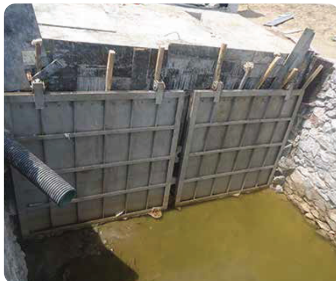
◆ Cung cấp và lắp đặt thiết bị van cửa phai, van cửa lật cho dự án FLC Samson Golf Link