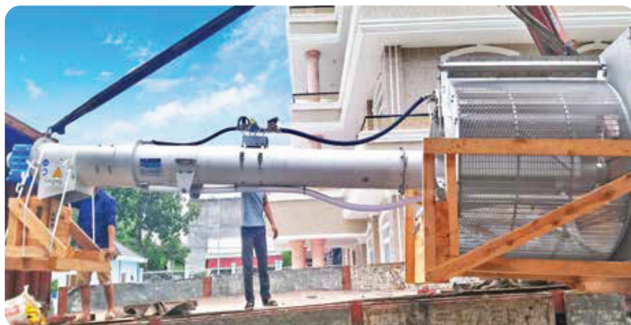
◆ Công ty CP Nước môi trường Bình Dương (BIWASE) Nhà máy Xử lý Nước thải Dĩ An, tỉnh Bình Dương