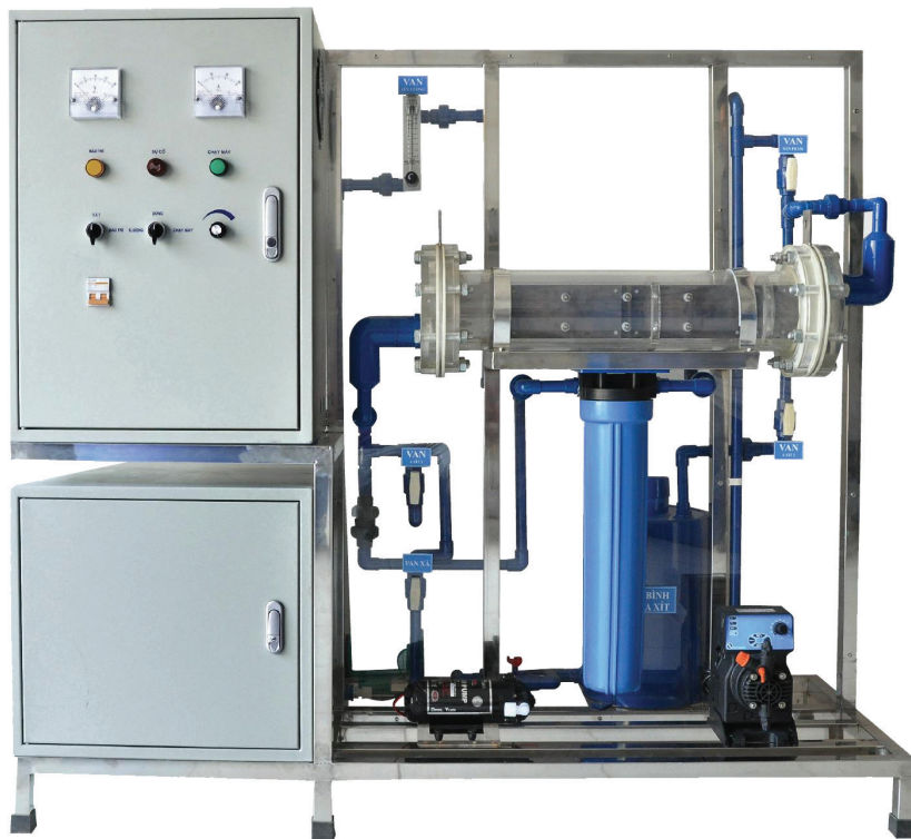
JAVEN WATER - C