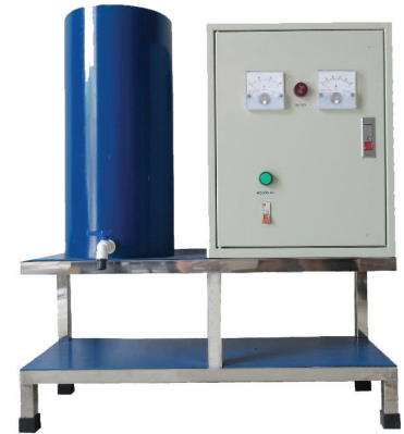
JAVEN WATER - M