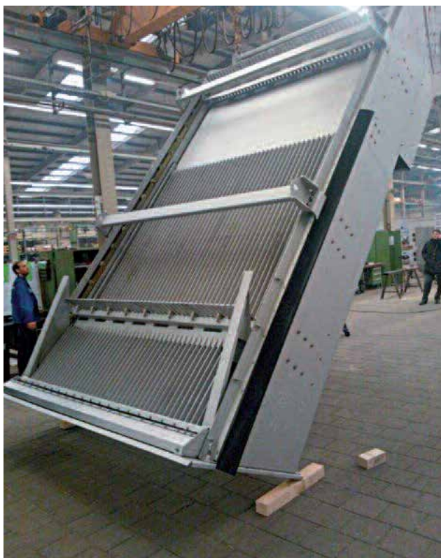
Song chắn rác thô TrashMax® HUBER sau khi lắp ráp sẵn sàng để chạy thử