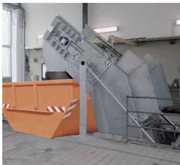
Lắp đặt bên trong nhà, xả rác trực tiếp vào thùng chứa