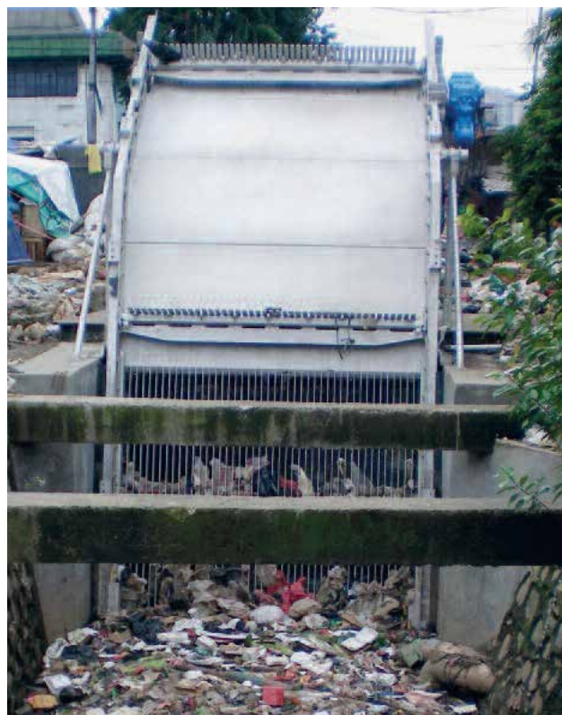
Song chắn rác thô TrashMax® HUBER hoạt động